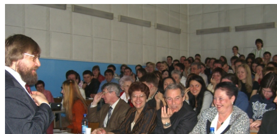
Апрель — ежегодная студенческая научно-практическая конференция