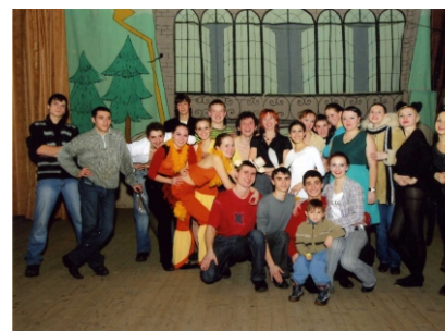
танцевальный коллектив “АКВАРЕЛЬ”