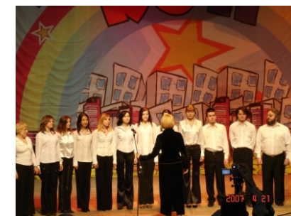
вокальный коллектив “А-ТЕМПО”