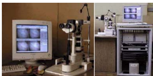
Рис.3. Аппаратно-программный кардиологический комплекс

Основные технические характеристики кардиокомплекса