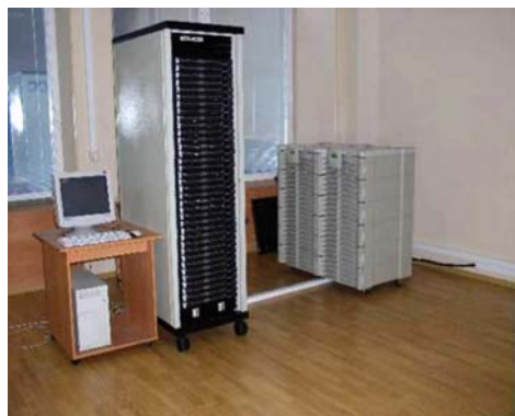
Рис. 10. Установка ЕС1710.03, НИЦЭВТ, Москва, ноябрь 2003 г.