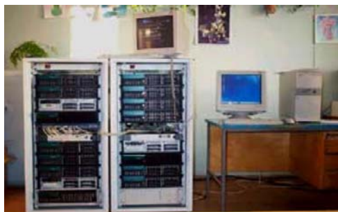
Рис. 2. Суперкомпьютерная установка ВМ-5100 семейства СКИФ