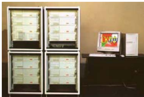
Рис. 5. Кластерная установка «Первенец-М», Переславль-Залесский, ИПС РАН, 2002 г.