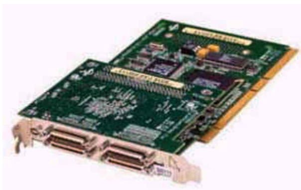
Рис. 11. Адаптер системной сети SCI N335, выпускаемый ОАО «НИЦЭВТ»