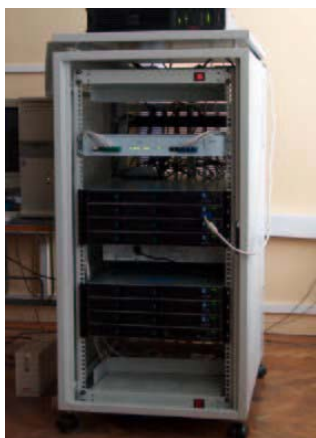
Рис. 8. Установка «Myrin»

В том же 2002г. для изучения технологии Myrinet в Минске (ОИПИ НАН Беларуси и УП «НИИЭВМ») был разработан кластер с условным названием «Myrin» (рис. 8, табл. 8).