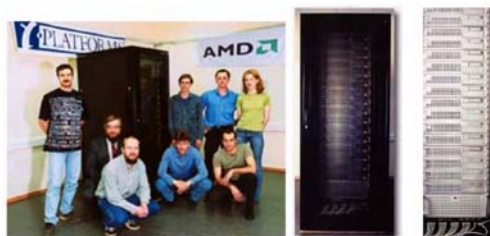
Рис. 9. «Т-Forge 32» на базе процессоров AMD Opteron 244, Москва, компания «Т-Платформы», июнь 2003 г.

ИПС РАН совместно с компанией «Т-Платформы» в июне 2003 г. была завершена сборка и проведена презентация первого в России кластера на базе процессоров AMD Opteron 244 - «Т-Forge 32» (рис. 9, табл. 9). Установка была реализована с системной сетью на базе плат GB Ethernet. Но даже на такой системной сети кластер показал весьма высокие технические характеристики: высокую пиковую производительность и очень хороший КПД (отношение реальной Linpack-производительности к пиковой производительности) – 64%. В рамках же одного узла процессоры Opteron показали еще лучшее соотношение между пиковой и реальной производительностью на задаче Linpack - 80%.