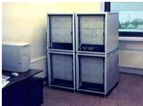
Рис. 1. Внешний вид первых двух кластеров СКИФ

«Первенцы» (рис. 1) были созданы в 2000 г. в условиях чрезвычайно ограниченных временных рамок. На первых образцах кластеров СКИФ, один из которых был установлен в Минске, второй - в Переславле-Залесском, была проведена установка первой прикладной системы для проектирования химических реакторов, разработанной в Санкт-Петербурге в Институте высокопроизводительных вычислений и информационных систем (ИВВ ИС). Так получилось, что уровень пиковой производительности этих образцов - 20 Гфлопс (табл. 1) соответствовал уровню эмбарго на тот момент на ввоз в Россию и Беларусь высокопроизводительной вычислительной техники. Ввоз такой техники требовал оформления особого разрешения.